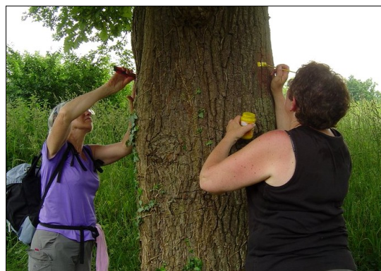
La précision est de rigueur

19h, la journée se termine, bien remplie, et durant laquelle deux baliseurs débutants ont pu bénéficier de l'expérience et des conseils de deux baliseurs confirmés tout disposés à partager leur « savoir ». "Il faudra programmer une autre journée, pour mettre en place les plaques et passer la deuxième couche de peinture des balises" décide