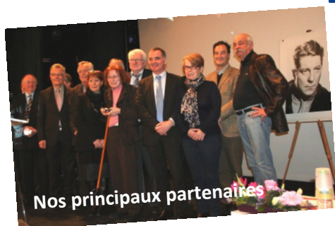
Nos principaux partenaires