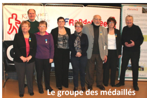
Le groupe des médaillés