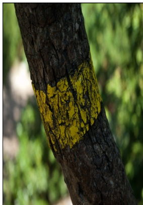
Balise à refaire

Ils ont parcouru le circuit et se sont appliqués à faire en sorte que les randonneurs puissent le suivre en se fiant au balisage. Les baliseurs ont donc rafraîchi ou rénové les balises délavées par les UV et les intempéries ; ils ont rajouté des balises et en ont retiré d'autres parce que l'environnement a changé, que les supports ont disparu... Il faut également rendre les balises visibles : cela veut aussi dire « jouer » du sécateur et de la scie quand la végétation les cache.